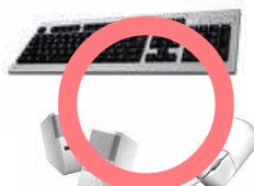
※付属品に限ります。

パソコンに付いてくる付属品。キーボードやマウス、スピーカーやケーブル類。購入時の付属品は、本体と同梱すれば回収してくれますが、後から購入した周辺機器は、たとえ同じメーカーの商品でも回収してはくれません。また、マニュアルやリカバリCD/DVDも回収対象にはなりませんので、自分で処分しなければなりません。